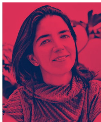
Fernanda Canales www.fernandacanales.com Vocal. Arquitectura i crítica