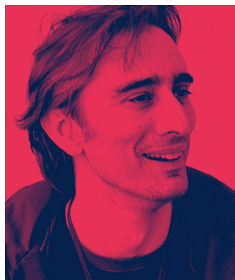
Martín Azúa www.martinazua.com Vocal. Disseny experimental