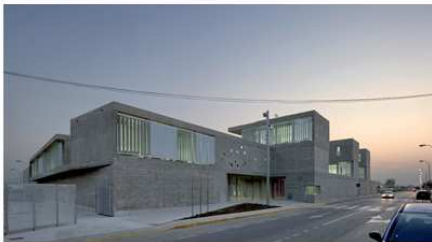
IES Rafal, premiado en la categoría de Arquitectura