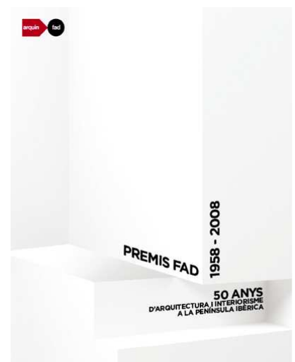
Portada del llibre "Premis FAD 1958-2008. 50 anys d'Arquitectura i Interiorisme a la Península Ibèrica".