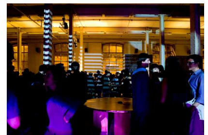
Cerimònia de lliurament dels Premis FAD d'Arquitectura i Interiorisme 2009