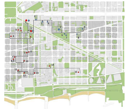
Mapa de les rutes arquitectòniques pel 22@.