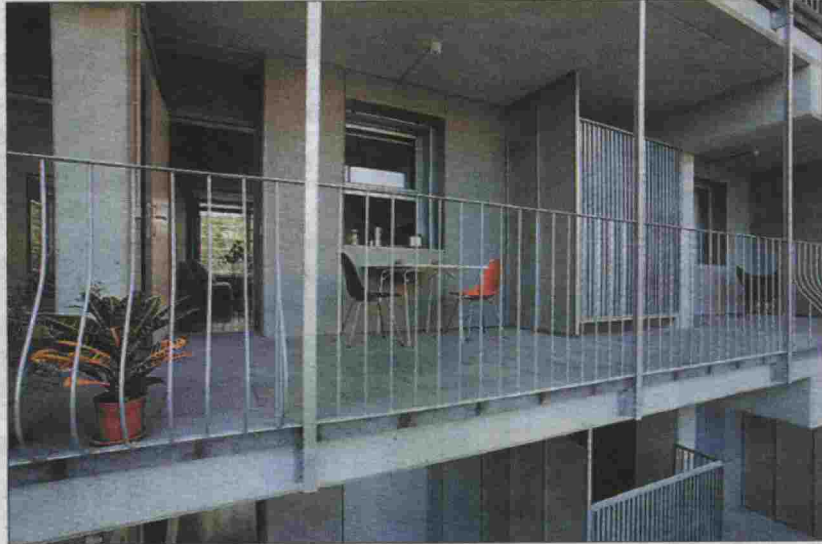
L'edifici de Sant Andreu guanyador del FAD, amb els balcons d'accés als pisos. / JOSÉ HEVIA

Però una de les parts més importants d'aquest edifici és sens dubte la passera d'accés. Podríem dir que en aquests habitatges s'entra pel balcó, que en estar situat al costat interior de l'illa sembla més una galeria que un balcó. Aquesta galeria és, en primer lloc, un espai d'expansió dels habitatges i explícitament es convida a fer-ne un ús més en repòs que dinàmic, més a prendre el cafè que a accedir a casa. A més, la passera resulta una excepcional aplicació de la idea que en aquests llocs resulten importantíssims els racons i les rugositats, perquè afavoreixen la vida i l'activitat, d'altra manera només es primària la velocitat. L'accés per passera és un problema crucial per l'arquitectura de l'habitatge econòmic de superfície mínima. Quan en un bloc es reuneixen molts habitatges petits, la forma més econòmica i senzilla d'accedir-hi no és anar posant escales i ascensors, sinó entrar per una galeria, així estalviem espai en escales i distribuïdors. Aquest és el sistema