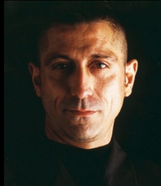
Por Andrés Juberías