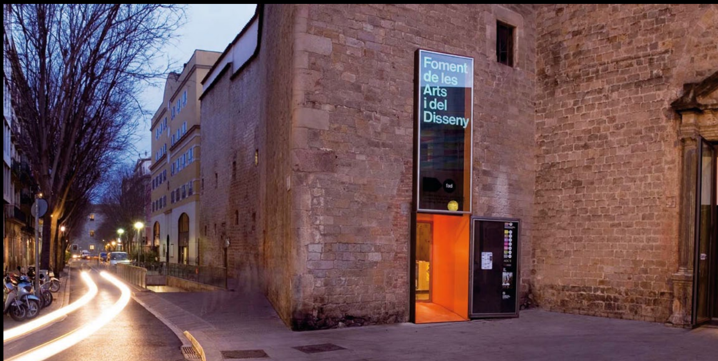
Entrada al FAD.