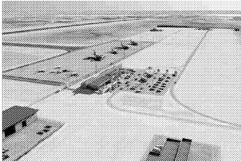
Recreación virtual de la estructura del futuro aeropuerto de Alguaire