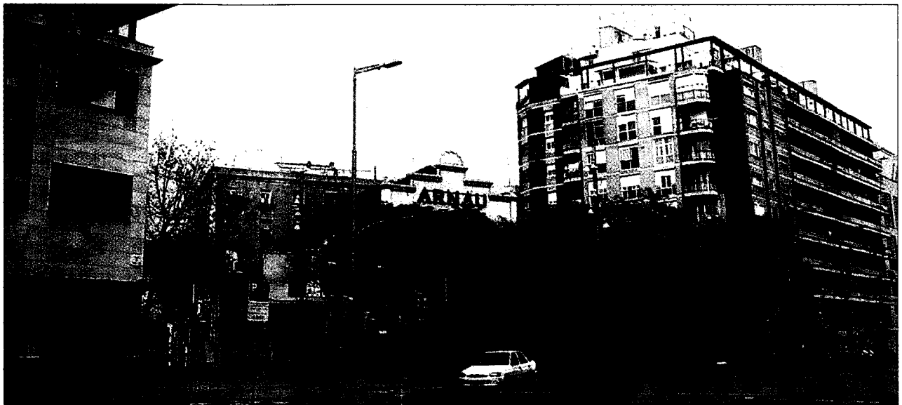
Imatges del Teatre Arnau, a l'Avinguda Paral·lel, l'any 1905 i en l'actualitat.