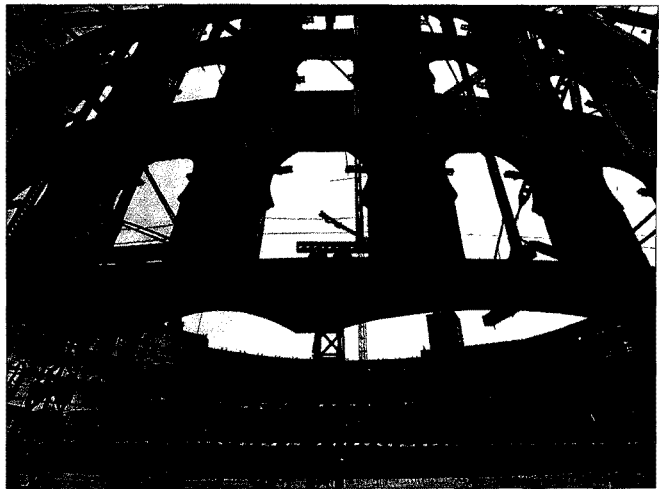
CARMEN SECANELLA La antigua plaza de toros de Las Arenas se convertirá en un centro comercial y de ocio. CARLES RIBAS