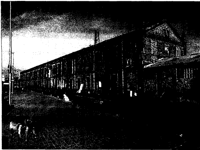
Una antigua fábrica del conjunto industrial de Can Ricart.