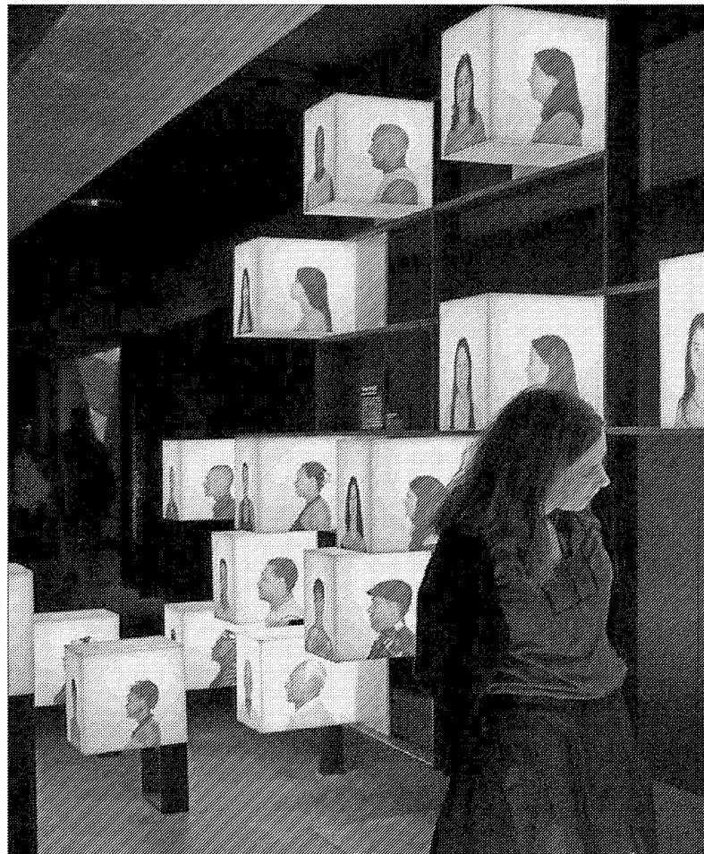
Exposició "Visca la diferència" al CosmoCaixa, una mostra de la diversitat de la nostra espècie. LA CAIXA

La música en viu és un altre repte per a la pròxima legislatura, així com la creació d'un circ estable. Conselleria i Ajuntament hi hauran de col·laborar.