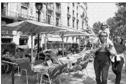
El disseny de les terrasses de la Rambla, a concurs ■ FRANCESC MELCION

En el camp de la gràfica, la darrera alarma ens ha arribat des de Madrid, on el ministeri de la presidència del govern ha convocat un concurs per a un logotip del propi govern d'Espanya amb l'ànim, pel que sembla, de crear una mena de marca. En fi, la convocatòria no hi ha per on agafarla. Es tracta d'un concurs obert, de fet no cal ni ser dissenyador