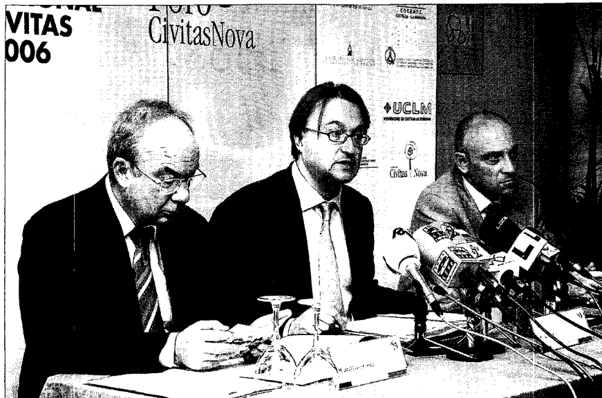
La presentación del Encuentro Internacional tuvo lugar ayer en los salones del Gran Hotel de Albacete.