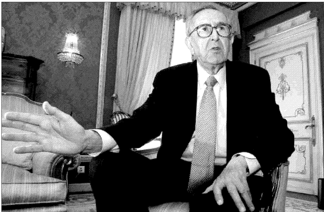
César Pelli tiene tres proyectos en desarrollo en España y uno en estudio.

César Pelli (Tucumán, Argentina, 1926), empieza la entrevista con contundencia: “No colecciono edificios como si fueran estampitas”. Ochenta años de vida y más de cincuenta de profesión otorgan autoridad y modestia al autor de las Torres Petronas de Kuala Lumpur, para asegurar a EXPANSIÓN que “no me falta ningún edificio por hacer; el arquitecto no es el que atrae el proyecto”. Un discurso en contra de las referencias habituales a considerar siempre como característicos los museos de Ghery, los puentes de Ca-