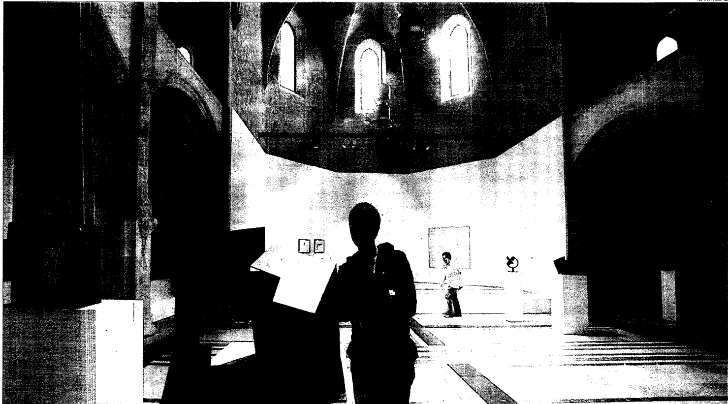
► El interior de la Capilla Macba, el nuevo espacio de exposiciones instalado en el antiguo convento de los Angeles.