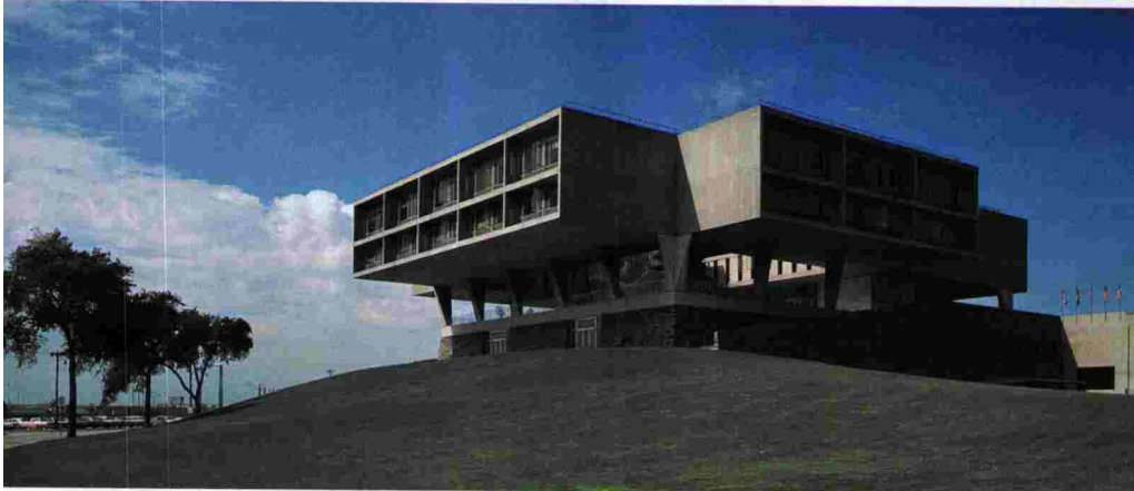
NUEVAS FORMAS. A cada proyecto, Saarinen imprimió su sello inconfundible. Desde la capilla Kramer (arriba a la izquierda), en Fort Wayne (Indiana), levantada en 1958, hasta el mobiliario del Cottage Miller; el Memorial de Guerra (sobre estas líneas) que construyó en la ciudad de Milwaukee (1957), o, abajo, el aeropuerto Dulles, en Virginia. Todas ellas, en Estados Unidos. Junto a la última, una imagen de la familia Saarinen.