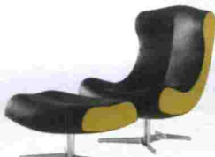
Butaca y reposa pies Alster de Emmanuel Dietrich para Ligne Roset. Precio, 1.976 y 1.025 euros respectivamente. www.ligne-roset.com