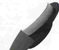
Mesa Meniscus de Pearson Lloyd para Tacchini. Mesa de centro ovalada en blanco y negro. Precio, 2.139 euros. www.tacchini.it