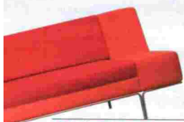
Sofá Diva de Claesson Koivisto Rune para Modus. Con combinaciones de dos tonos. Precio, 3.020 euros. www.modusfurniture.co.uk