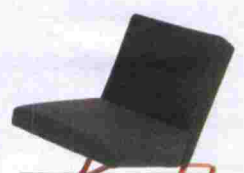
Butaca Satyr del equipo ForUse para Classicon. Tiene las patas de un color opuesto al tapizado. Precio, 670 euros. www.classicon.com