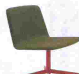
Silla Sit de Michael Sodeau para Modus. Con asiento en verde manzana y base en rojo. Precio, 758,56 euros. www.modusfurniture.co.uk