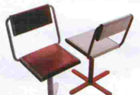
Silla Zoe de Roberto Lazzeroni para Fasem. Se combina el naranja y el claro. Asiento y respaldo de piel. Precio, 741,60 euros. www.fasem.it