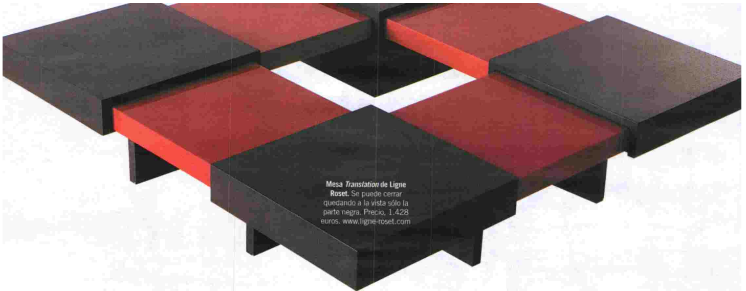
Mesa Translation de Ligne Roset. Se puede cerrar quedando a la vista sólo la parte negra. Precio, 1.428 euros. www.ligne-roset.com