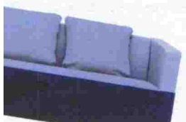
Sofá Waterline de Eero Koivisto para Offect. Con dos tonos de azul. Precio, entre 2.833 y 3.170 euros según el tapizado. www.offect.se