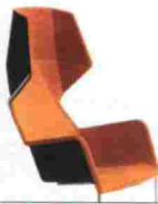
Silla Pekaboo de Stefan Borselius para Bla Station. Se completa con una "tapadera" adicional. Precio, 1.259 euros aprox. www.blastation.se