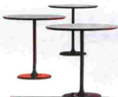
Mesas Dizzie de Lievore, Alther y Molina para Arper. Tablero blanco que combina con bases de colores. Precio, 280 euros. www.arper.it

blanca y verde By the Pool de Quinze & Milan o la mesa negra y roja Translation de Ligne Roset. El naranja es el color estrella cuando los diseñadores se decantan por un tono cálido. Así, Roberto Lazzeroni lo combina con blanco para la Zoe de Fasem. También son comunes las combinaciones de colores complementarios al estilo de la silla Sit de Michael Sodeau para Modus, tapizada en verde y con las patas en rojo. Y aunque a veces resulte un poco chocante hasta se eligen colores análogos, como el sofá Easy Sleep de Domodinámica que combina rojo y naranja. ■