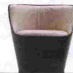
Butaca Big Shell de Roberto Lazzeroni para Fasem. Tapizada por completo en piel en colores blanco y negro. Precio, 2.358 euros. www.fasem.it