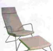
Tumbona y reposapiés By the Pool de Arne Quinze para Quinze&Milan. Precio, 600 y 220 euros respectivamente. www.quinzeandmilan.tv