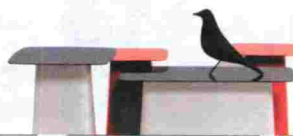
Mesa Metal Side de los hermanos Bouroullec para Vitra. Precio, entre 358 y 476 euros según tamaño. www.vitra.com