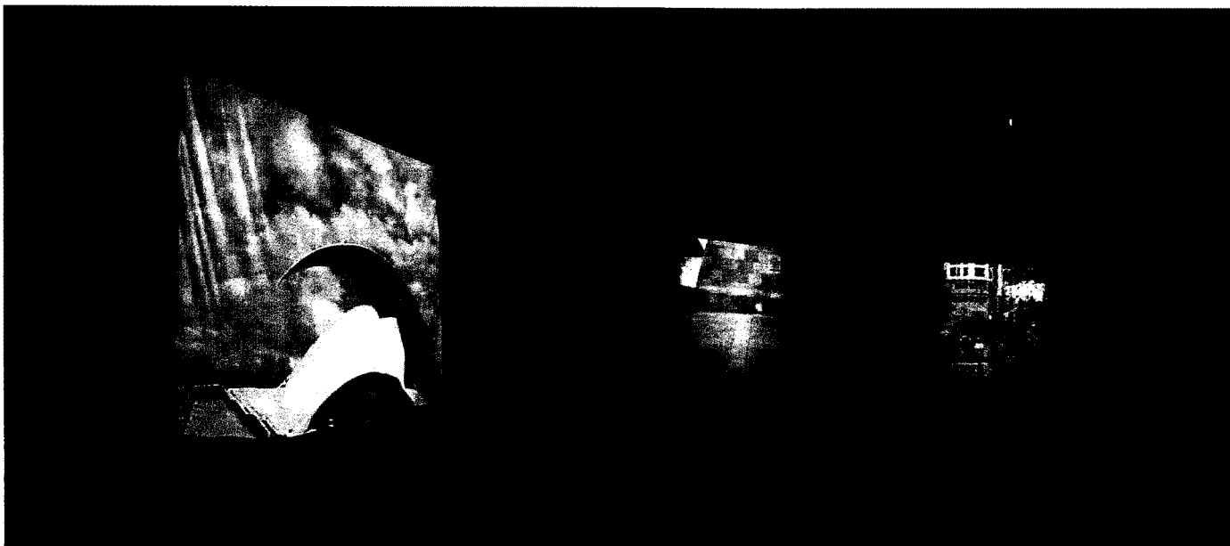
Montaje de Salomé Cuesta y Bárbaro Miyares en el Castillo Negro.