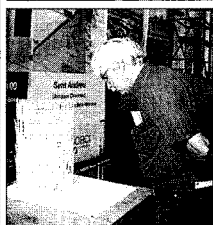
A la izquierda, maqueta del Edificio Sagrera, de Frank Gehry. Arriba, el MediaTic. Junto a estas líneas, un visitante de la exposición de El Consorci observa el proyecto Diagonal 00.