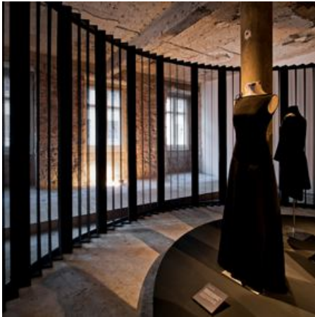
Fotógrafo: FG + SG FOTOGRAFIA DE ARQUITECTURA

INÉS VIEIRA DA SILVA, MIGUEL VIEIRA, arquitectos (SAMI-ARQUITECTOS) NUNO BOTELHO DE GUSMÃO, diseñador (P-06 ATELIER AMBIENTES E COMUNICAÇÃO)