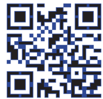
COLLECTIVE ARCHITECTURES ARQUITECTURAS COLECTIVAS Camiones, Contenedores, Colectivos