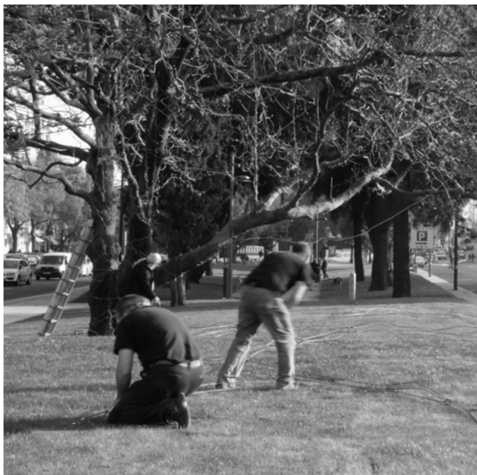
MONTAGEM DA INSTALAÇÃO