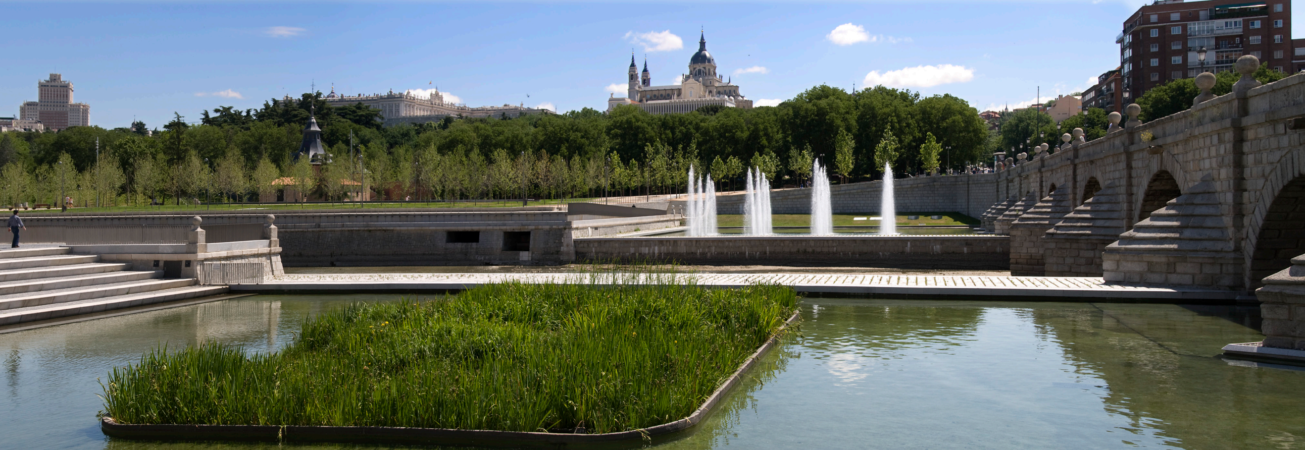
jardines del puente de segovia