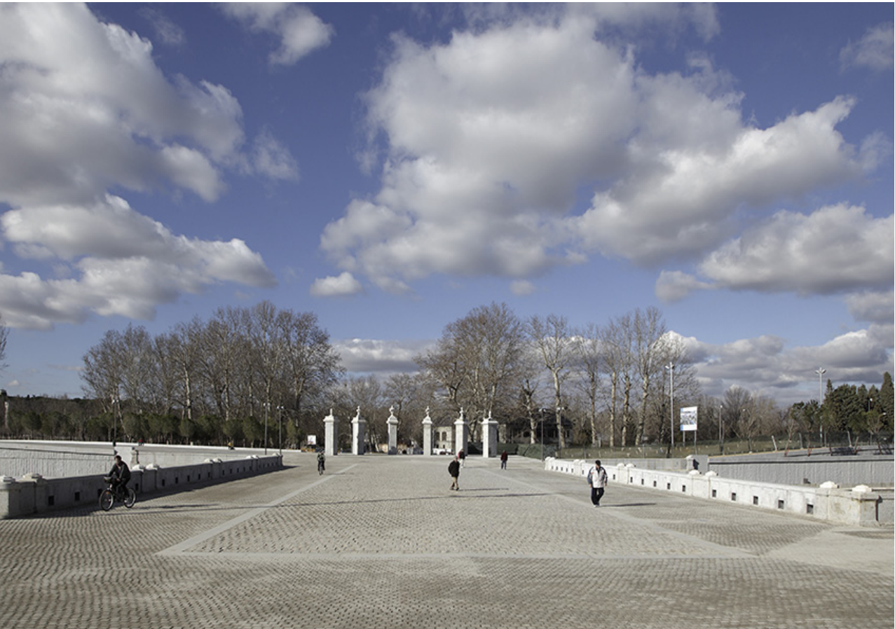
puente del rey