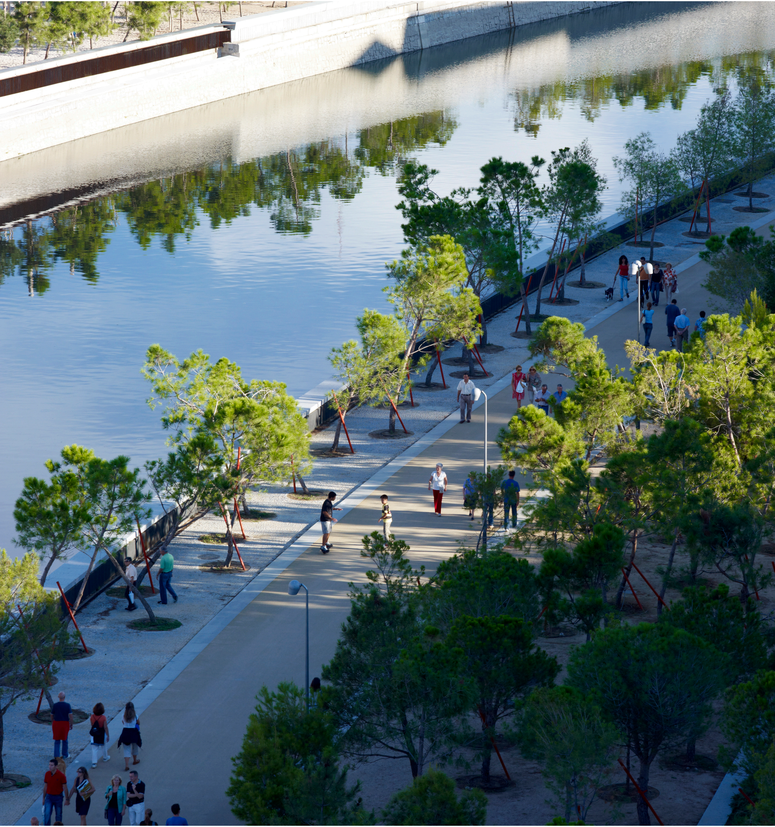
salón de pino